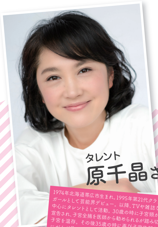
タレント 原千晶さん

1974年北海道帯広市生まれ。1995年第21代クラリオンガールとして芸能界デビュー。以降、TVや雑誌などを中心にタレントとして活動。30歳の時に子宮頸がんを宣告され、子宮全摘を医師から勧められるが踏み切らず子宮を温存。その後35歳の時に再び子宮体部と頸部にがんが見つかり、手術と抗がん剤治療を行う。